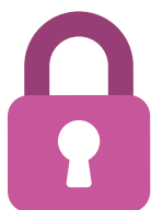
Pentest (Black & grey box)