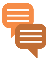
Management Awareness sessie