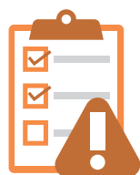
Intake en Risk Assessment